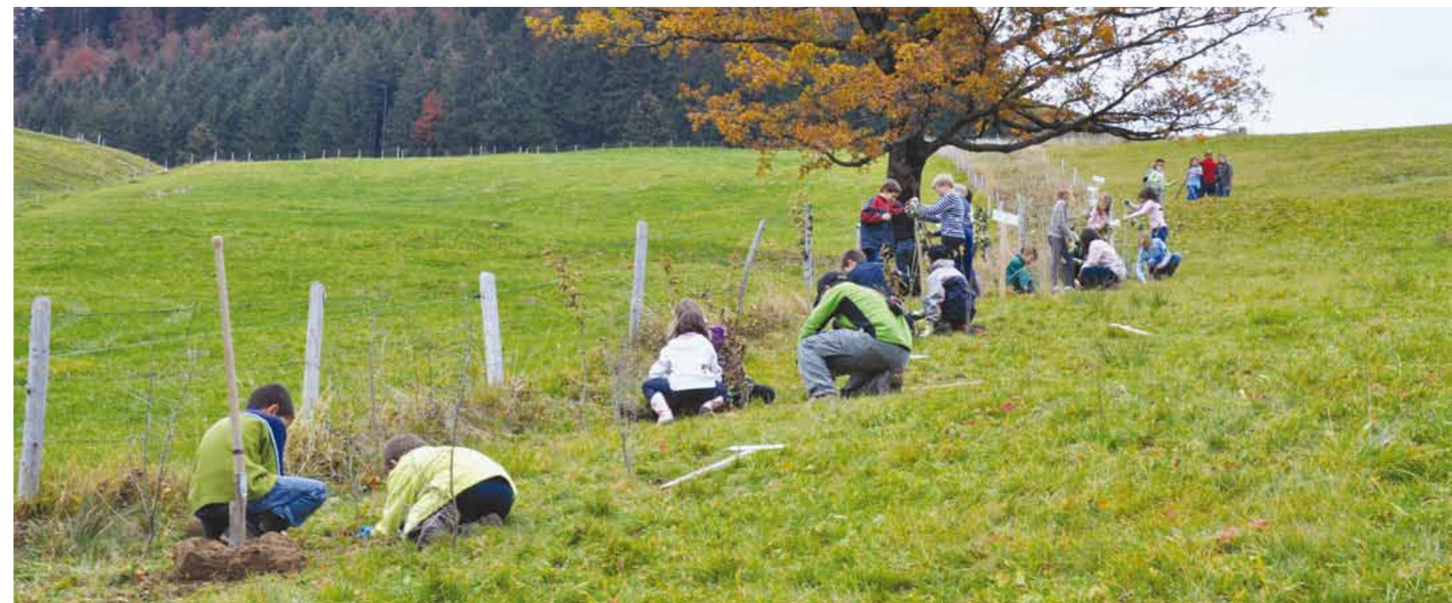
Une leçon en plein air, les mains dans la terre, pour les 4 e primaire du Cercle scolaire de la vallée de la Jagne

Bien que les soins aux animaux tiennent une part prépondérante dans notre concept de prise en charge thérapeutique, les autres activités (jardinage et cultures maraîchères, travaux de menuiserie, entretien des maisons et de l'environnement, arts plastiques), s'inscrivent également dans le processus de rétablissement du résident à travers la valorisation de ses propres ressources, quintessence permettant de donner forme à son avenir.