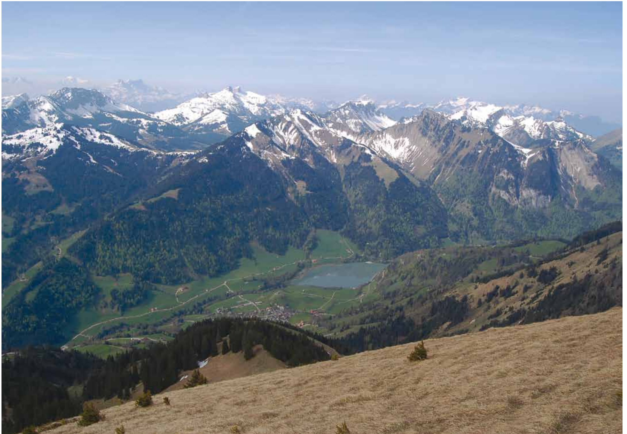
Les forêts mixtes de la vallée de la Sarine à Rossinière et la partie sud du Parc, du Mont d'Or au col de Jaman, intégrées à l'inventaire fédéral des paysages (IFP Tour d'Al - Dent de Corjon)