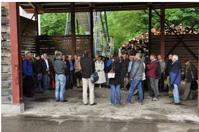
En juin 2016 avant l'assemblée générale visite de la scierie des Avants Juni 2016, vor der Generalversammlung: Besuch des Sägewerks in Les Avants

Im Februar 2012 wurde dem Regionalen Naturpark Gruyère Pays-d'Enhaut das Label «Park von nationaler Bedeutung» verliehen, das bis 2021 (zehn Jahre) gültig ist. Der zwischen der Waadtler Riviera und dem Schwarzsee sowie zwischen Gruyères und Gstaad gelegene Park ist von einer noch ursprünglichen voralpinen, ländlichen Identität geprägt und seit dem 19. Jahrhundert von touristischer Bedeutung. Er ist mit drei AOP-Käsen für die Alpwirtschaft (Alpen, Alphütten und Käse) bekannt: L'Etivaz, Le Gruyère und Le Vacherin Fribourgeois. Sein Gebiet umfasst um die 12'500 Einwohner und erstreckt sich auf 13 Gemeinden (7 Waadtler: Rougemont, Château-d'Ex, Les Mosses / Ormont-Dessous, Rossinière, Villeneuve, Veytaux, Montreux und 6 Freiburger: Val-de-Charmey, Crésuz, Châtel-sur-Montsalvens, Bas-Intymanon, Grandvillard, Haut-Intymanon). Der Park verbindet auf einzigartige Weise die Menschen, die Kultur und die Natur dieser Region der westlichen Voralpen, die sich durch aussergewöhnliche Landschaften, Artenreichtum, ihre Landwirtschaft, ihre lebendigen Traditionen, ihre im 21. Jahrhundert wurzelnden Handwerker und ihr Bestreben auszeichnet, ein Gebiet (ein Park) zum Leben und Erleben zu sein.