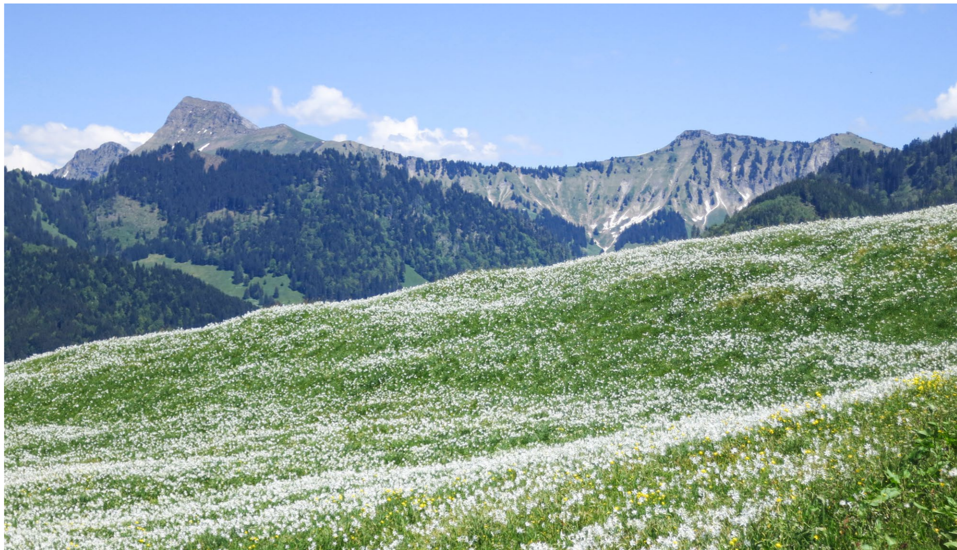
La neige im mai, une fleur emblématique du Parc : les narcisses