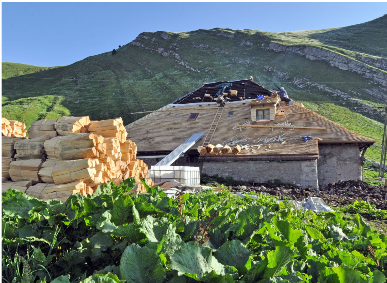
Tavillonage (le logo du Parc) au chalet en Lys dans l'Intymanon Schindelmacher (Parklogo), Chalet de Lys im Intymanon