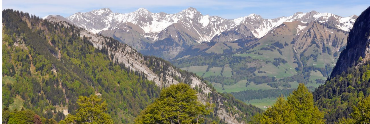
La chaîne des Vanils Die Bergkette der Vanils