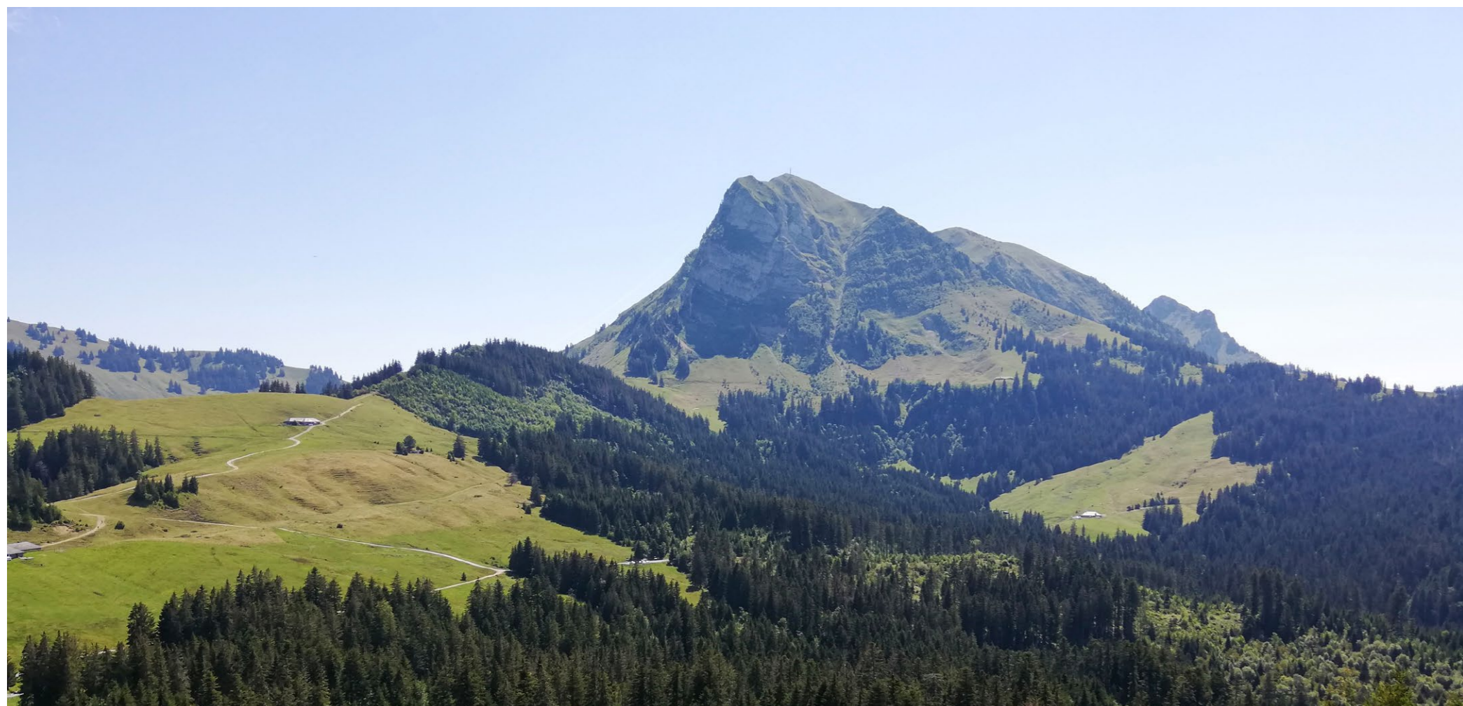
Le Moléson vu depuis le Maulatré d'Amont, avec en premier plan les forêts du bassin-versant la Trême, les alpages des Grosses Clés et de la Joux-Devant