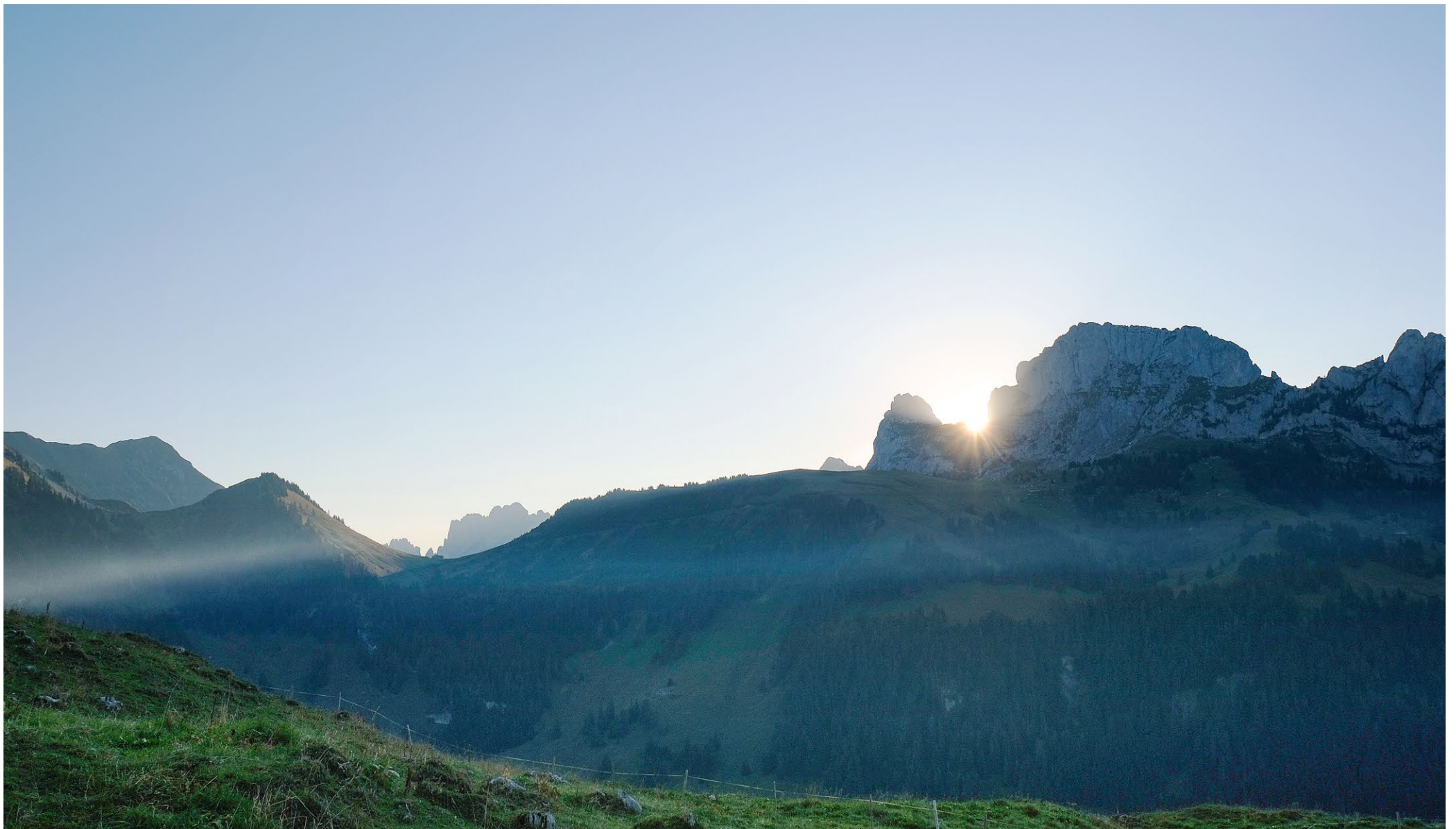
Le Parc, à l'aube d'une nouvelle charte