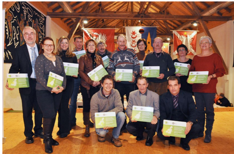
Montbovon, le 12 février 2012, les représentant des communes (14) reçoivent le label Parc de la première charte (2012-2021)