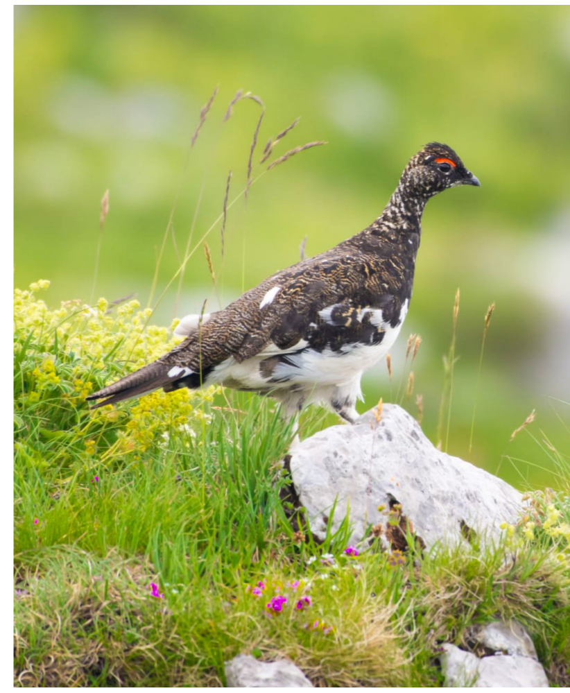
Lagopède mâle, avec son plumage d'été