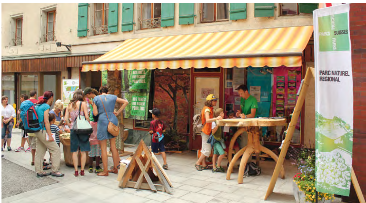
Le Parc au Festival au Pays des enfants en 2016 sur le thème du bois