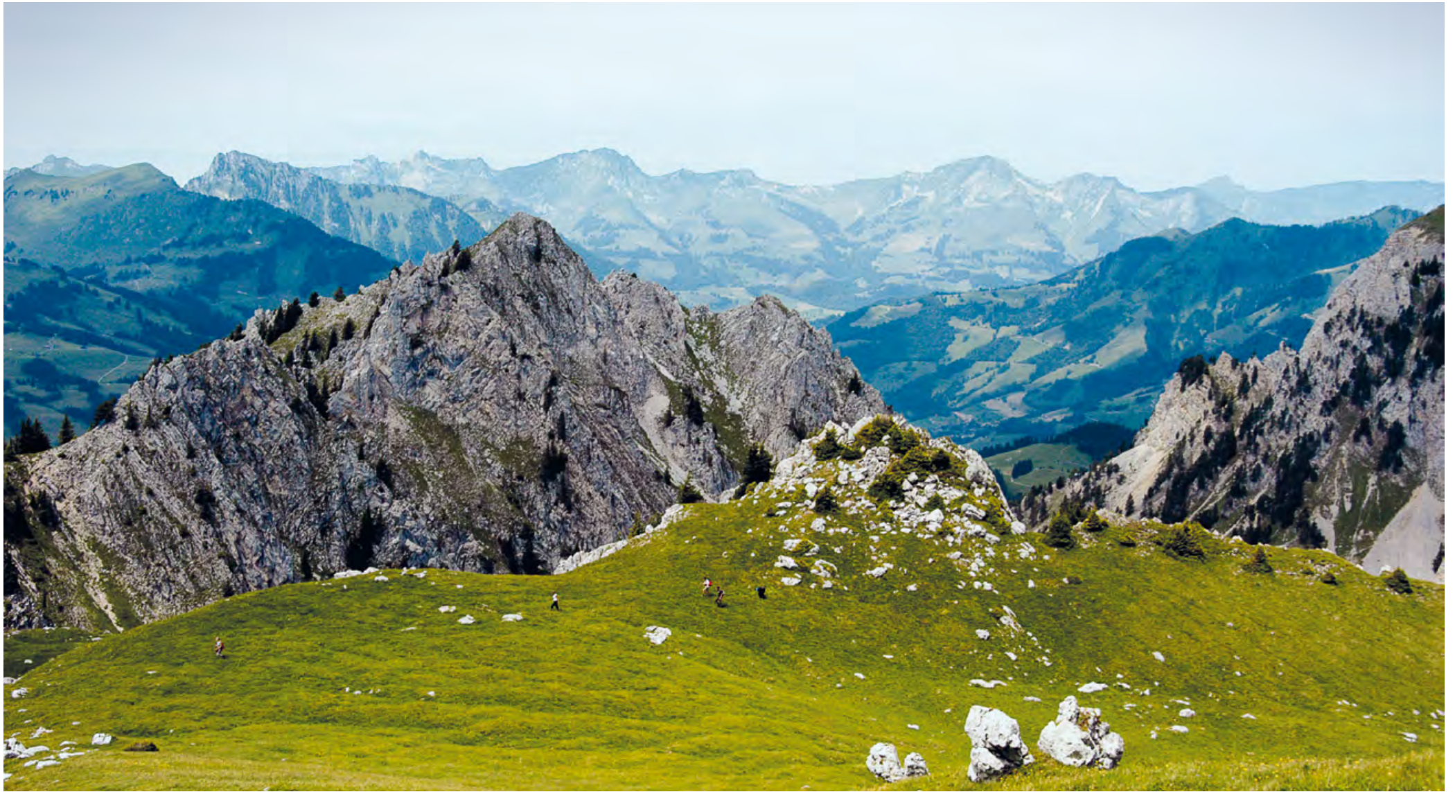
Le Grand Tour des Vanils affirme son caractère montagneux dans des paysages exceptionnels