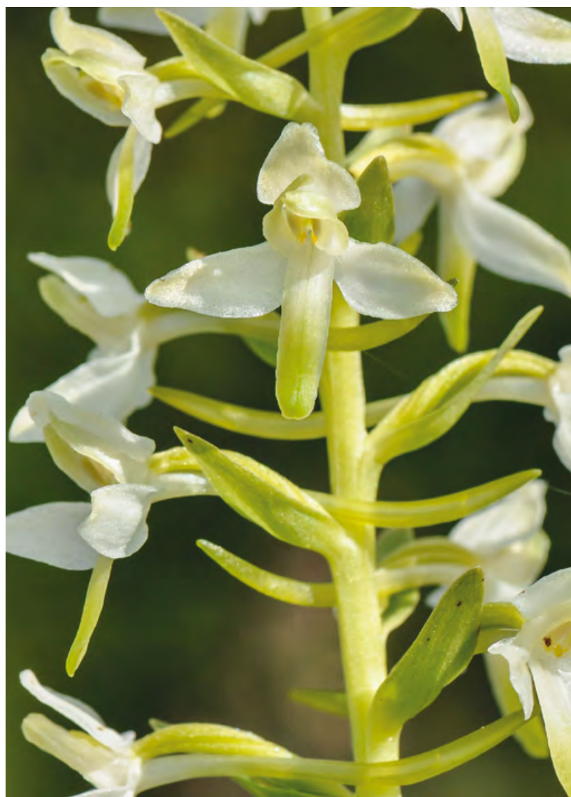
Platanthère à deux feuilles vue sur cinq parcelles dans le cadre du concours des prairies fleuries 2016

Cet itinéraire fait le tour de l'ancien Comté de Gruyère et de ses riches héritages patrimoniaux symbolisés par la grue. Réalisable en deux jours, il permet de traverser des paysages et villages préalpins typiques classés d'importance nationale et de découvrir de