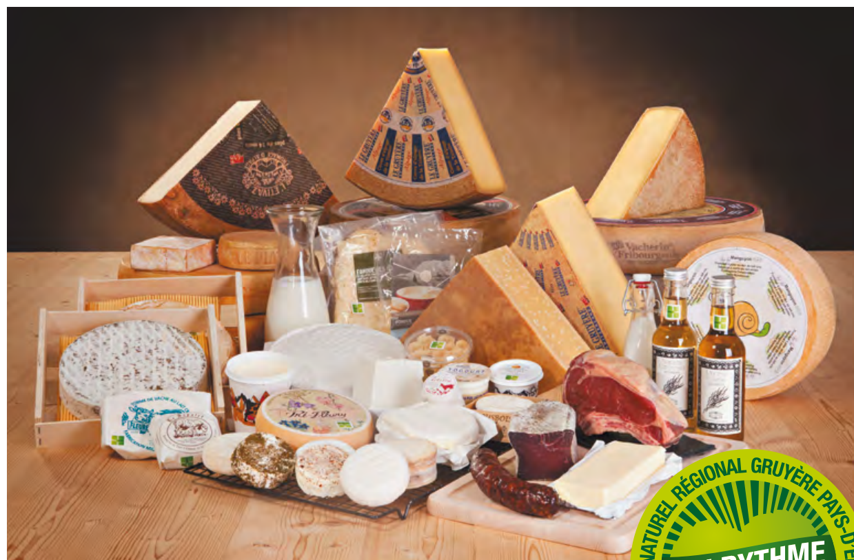
Les produits labellisés par le Parc naturel régional Gruyère Pays-d'Enhaut