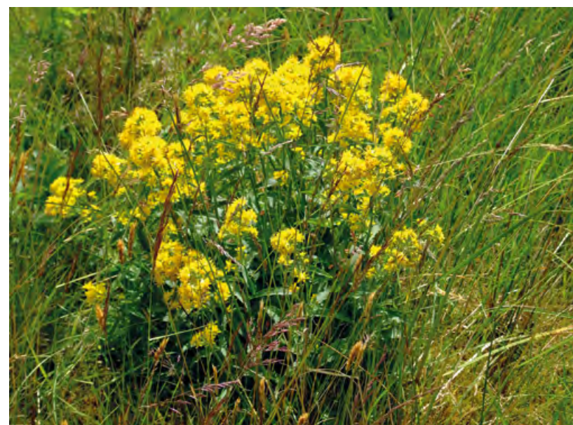
Solidago américain en fleur

Deux accès : depuis la Comballaz, proche du Col de Mosses, ou depuis la Berneuse, au-dessus de Leysin. Du hameau de la Comballaz, desservi par la ligne de bus Le Sépey - Col des Mosses, il faut compter environ deux heures de marche pour accéder aux premiers lapiés (5,6 km, + 500 m), en passant par la Pierre du Moëllé (buvette). Trente-cinq minutes sont nécessaires (1,3 km, + 170 m) depuis le parking de la Pierre du Moëllé. Les chemins d'accès sont bien indiqués et balisés. A certains endroits, le sentier peut être assez raide et glissant. Des passages sur les lapiés demandent de s'aider des mains et beaucoup de prudence.