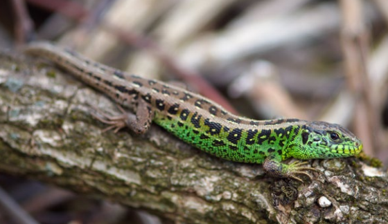
Lézard agile mâle