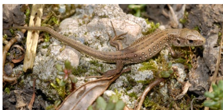
Lézard agile juvénile