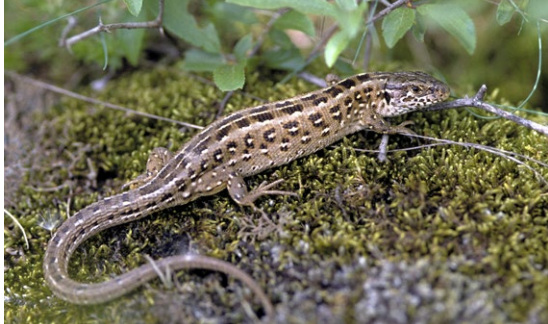
Lézard agile femelle