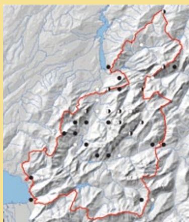
Observation dans le Parc naturel régional Gruyère Pays-d'Enhaut par zone de 2 x 2 km. • avant 1992 • 1992-1999 • 2000-2009

Dès lors, le Parc s'engage pour une meilleure connaissance de ces animaux et de leurs écosystèmes afin de garantir leur survie et permettre une cohabitation harmonieuse avec l'homme. La coronelle lisse, ainsi que les 7 autres espèces de reptiles présents dans le Parc ont fait récemment l'objet d'une exposition itinérante à l'intention des élèves et du grand public (plus de 1000 personnes l'ont visitée). Les agriculteurs s'engagent également à maintenir des tas de pierres et d'autres sites appréciés de la coronelle dans le cadre des réseaux écologiques.