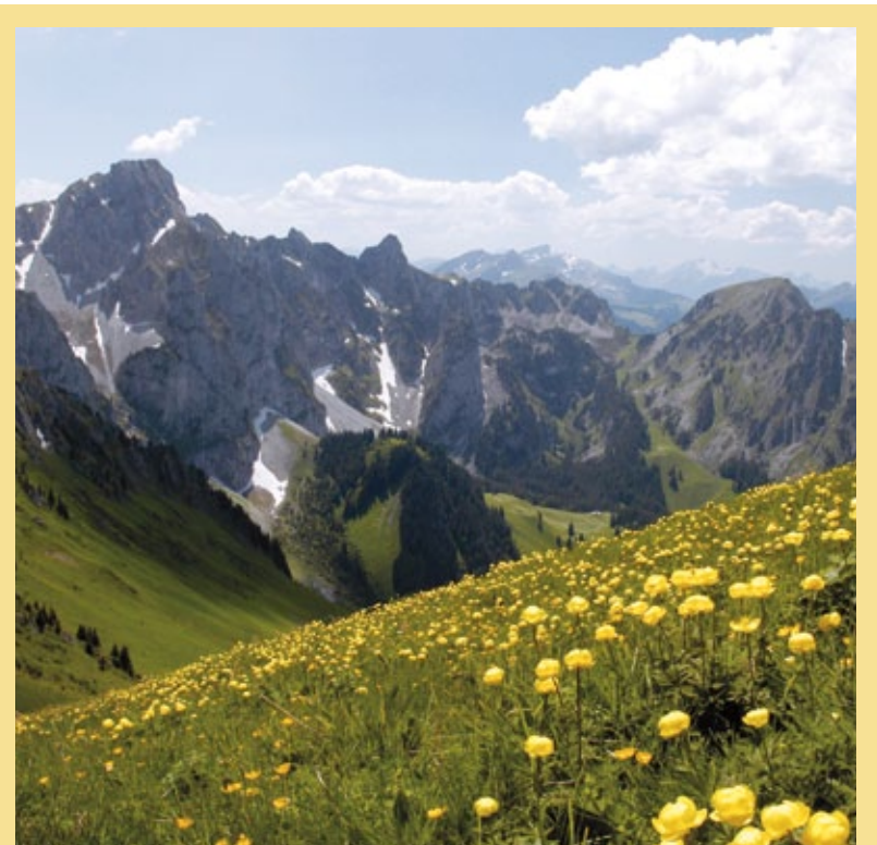
La réserve Pro Natura de la Pieurreuse (Château-d'Œx) et ses trolles en fleur