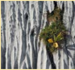
Lapié de Famelon, Ormont-Dessous