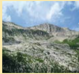
Vallon des Morteys (Val-de-Charney)