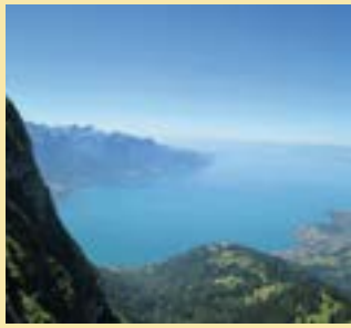
Les Rochers de Naye (Veytaux)