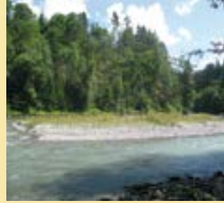
Zone alluviale du Ramaclé (Château-d'Œx)