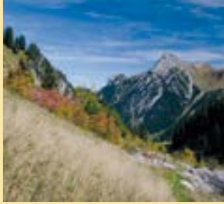
Site marécageux du Col des Mosses (Ormont-Dessous)